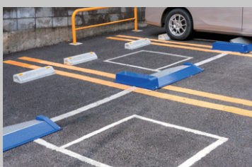
月極・コインパーキング